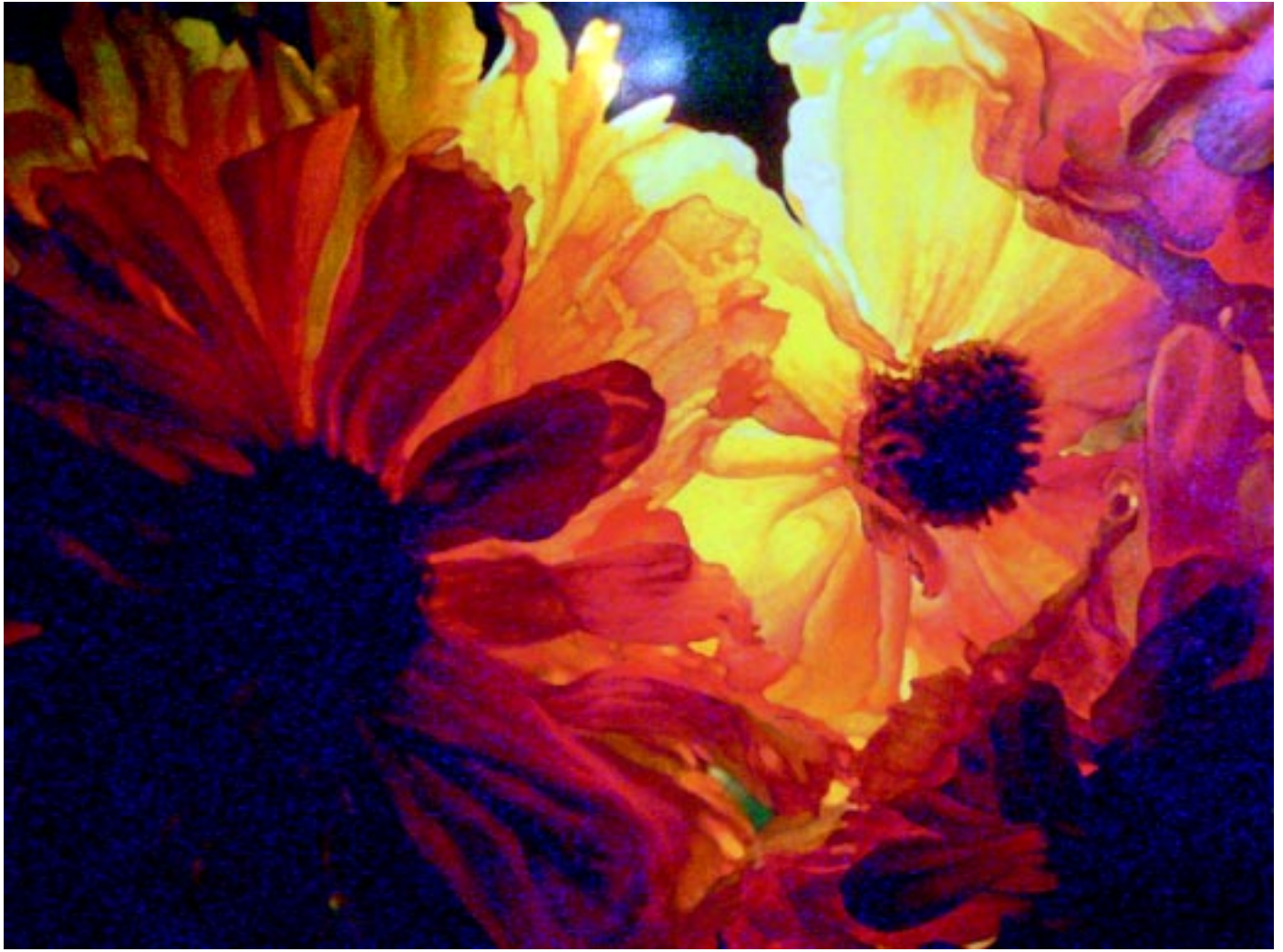
sain che - 91 x 120 cm, acrylic