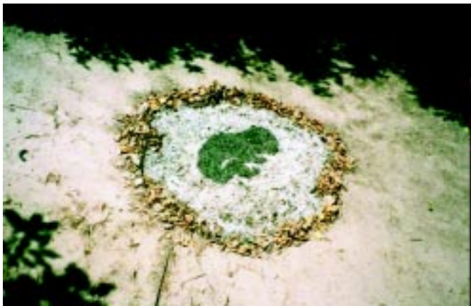
the Ashes # 2 2003, burned dry leaves and branches, dimensions variable