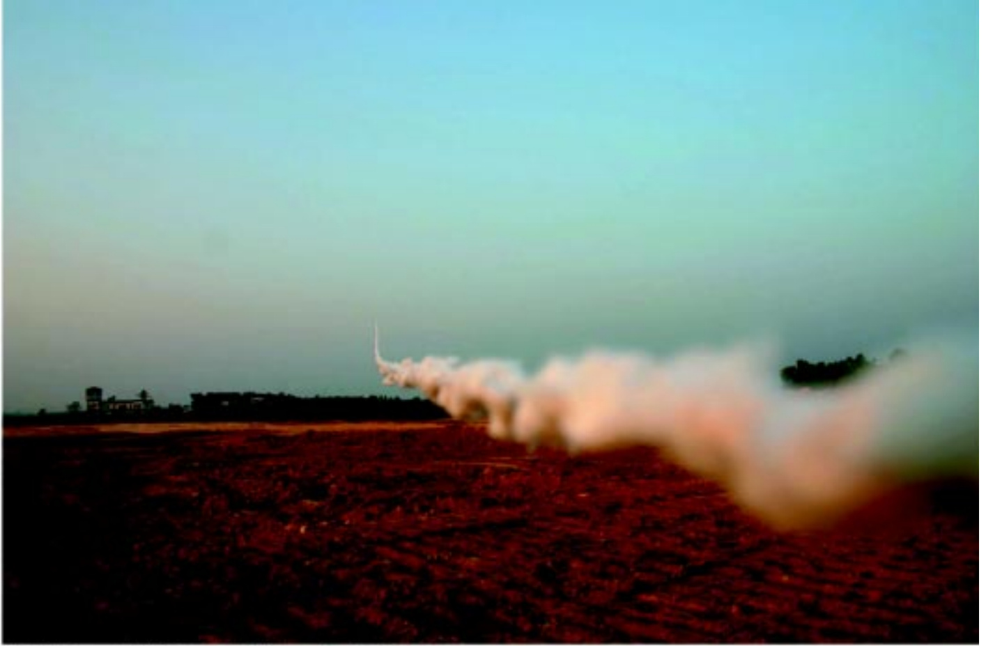
Min Thein Sung, Untitled, 2009, digital photographs, 45.72 x 30.48 cm