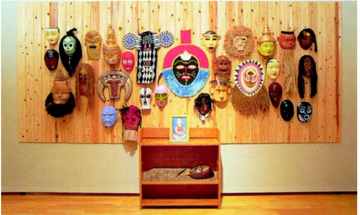
Man and Masks - 2001, mixed medium, dimensions variable, collection of the Fukuoka Asian Art Museum