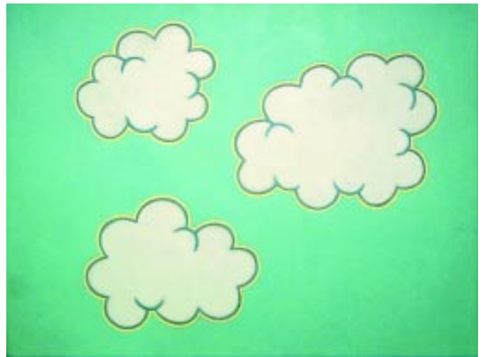
Cloud #51 , 2006, acrylic on canvas, 61 x 46 cm