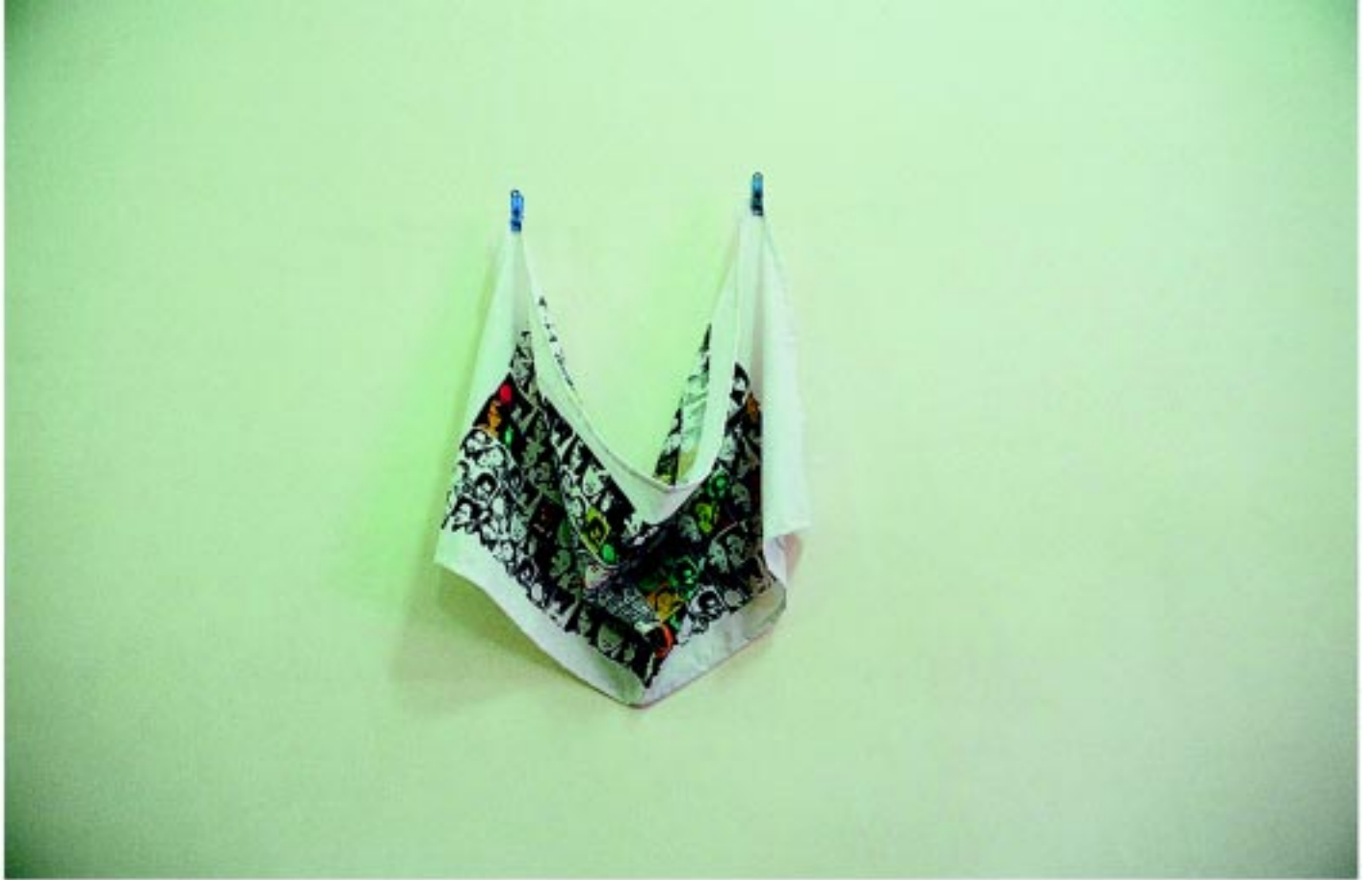
Phyo Kyi, Game within Mother and Son , 2003, silks creen print on linen, 50.8 x 87.6 cm