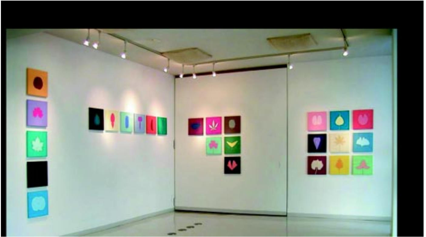
Installation view of Self-Identity at Art-U Room in Tokyo - 2005, 26 acrylic paintings on canvas, 28 x 28 cm each, private collection