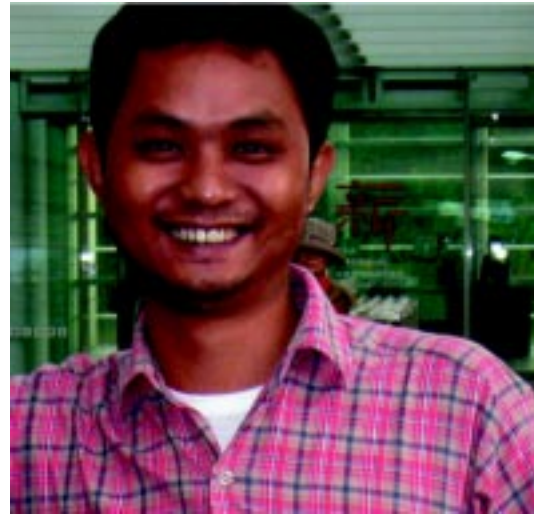
How Our Education Done! - 2009, 10 multi-shot 16 digital photographs, 34,93 x 45,72 cm each

Weed Row on Middle Sandbank of Ayeyarwady River, Mingoon, Myanmar, 2007