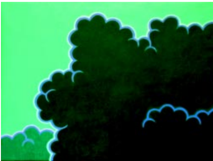
Cloud #48 , 2006, acrylic on canvas, 61 x 46 cm